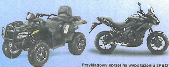
Przykładowy sprzęt na wyposażeniu 3PBOT

3 Podkarpacka Brygada Obrony Terytorialnej (3 PBOT) wchodzi w skład Wojsk Obrony Terytorialnej (WOT) będących piątym, samodzielnym rodzajem sił zbrojnych. Misją brygady będzie obrona oraz wspieranie lokalnej społeczności w czasie konfliktu zbrojnego, ale także podczas klęsk żywiołowych lub katastrof. 3 PBOT będzie liczyła ok. 3500 żołnierzy, których służba będzie trwała od 1 roku do 6 lat (z możliwością jej przedłużenia). Do końca 2017 roku zaplanowano utworzenie 5 batalionów, które wejdą w skład brygady. Bataliony będą rozmieszczone w Nisku, Rzeszowie, Jarosławiu, Sanoku, Dębicy.