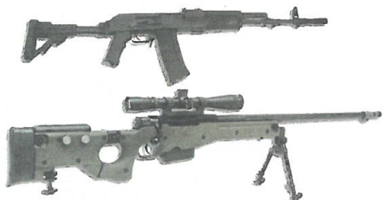
Przykładowa broń na wyposażeniu 3PBOT