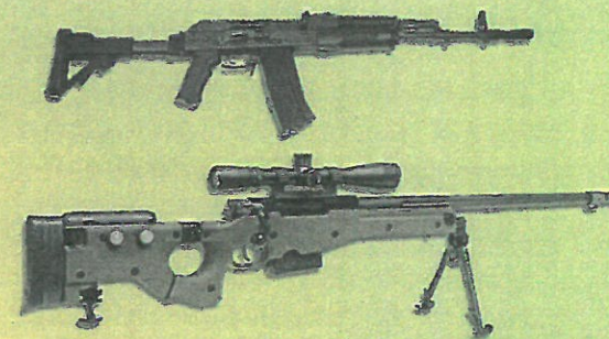
Przykładowa broń na wyposażeniu 3PBOT