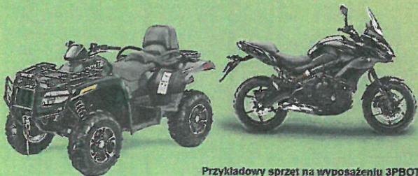
Przykładowy sprzęt na wyposażeniu 3PBOT

Przydać się też może rekomendacja władz pozarządowej organizacji proobronnej, jeśli kandydat do 3 PBOT jest jej członkiem. Albo zaświadczenie, że ukończył szkołę realizującą innowacyjny lub eksperymentalny program przysposobienia obronnego albo edukacji dla bezpieczeństwa. Takie dokumenty mogą się okazać ważne, ustawa bowiem wskazuje, że członkowie takich organizacji oraz absolwenci klas mundurowych mają pierwszeństwo w naborze do 3PBOT. W pierwszej kolejności będą też rozpatrywane wnioski byłych żołnierzy zawodowych oraz osób, które mają pobyt stały lub czasowy powyżej trzech miesięcy na terenie działania danej jednostki 3 PBOT.